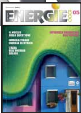
copertina di Marika Moreschi /Antonella Rampichini