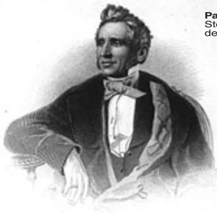
Pag 30 Storia di Goodyear, il papà della gomma.